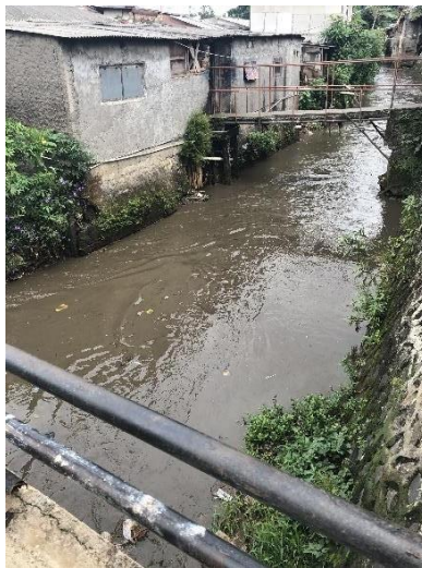
Gambar 2. Kondisi Sekitar Badan Air Kecamatan Pasar Rebo

Banyak bangunan liar dan pemukiman tanpa izin yang berada di sepanjang pinggir badan air Kecamatan Pasar Rebo yang jaraknya tidak sesuai dengan Peraturan Pemerintah No 38 tahun 2011 tentang Sungai yaitu 10 – 20 m dair sependan sungai (Gambar 2). Kegiatan rumah tangga yang dilakukan oleh bangunan tersebut menghasilkan sisa dan/atau buangan yang langsung di buang ke badan air secara diam-diam merupakan salah satu sumber sampah terbesar di badan air Kecamatan Pasar Rebo.