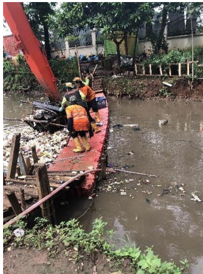
Gambar 3. Alat Penahanan Sampah

Sistem pengangkutan ini, dilakukan pada 37 titik sepanjang aliran air yang berada di Kecamatan Pasar Rebo. Sampah dari hulu, berasal dari aliran air Depok didorong menuju titik pengangkutan, sehingga setiap sampah berkumpul pada titik-titik pengangkutan agar mudah diangkut. Titik pengangkutan ditentukan dari jarak maksimal yaitu 2 km dari sumber sampah. Setiap titiknya memiliki 2 – 6 petugas yang dikerahkan untuk melakukan penelusuran sampah hingga dilakukannya pengangkutan, dan 1 pengawas per satu badan air. Jumlah petugas ditentukan oleh pengawas berdasarkan pada kondisi topografi badan air, cuaca, dan visualisasi banyaknya sampah. Setiap titik pengangkutan memiliki alat penahanan sampah guna untuk menyaring dan menahan sampah yang mengalir agar terkumpul dan segera dilakukan pengangkutan ke dalam bak kapasitas alat angkut (Gambar 3). Sampah yang telah masuk ke dalam bak kapasitas dipadatkan oleh petugas untuk mencegah terjadinya overload atau kelebihan muatan, kemudian ditutup oleh terpal agar tidak tercecer pada saat menuju emplacement atau tempat penampungan sementara.